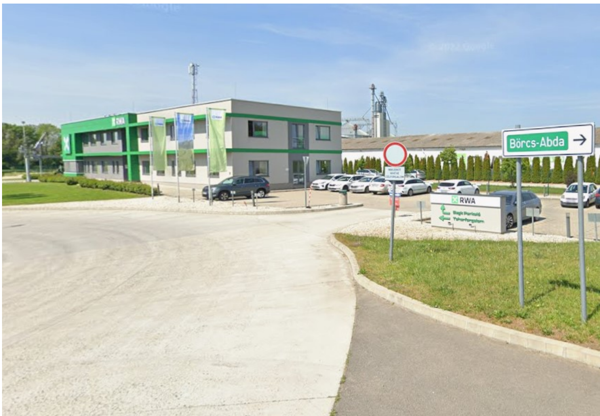
(az RWA Magyarország Kft telephelye Győr felől érkezte)