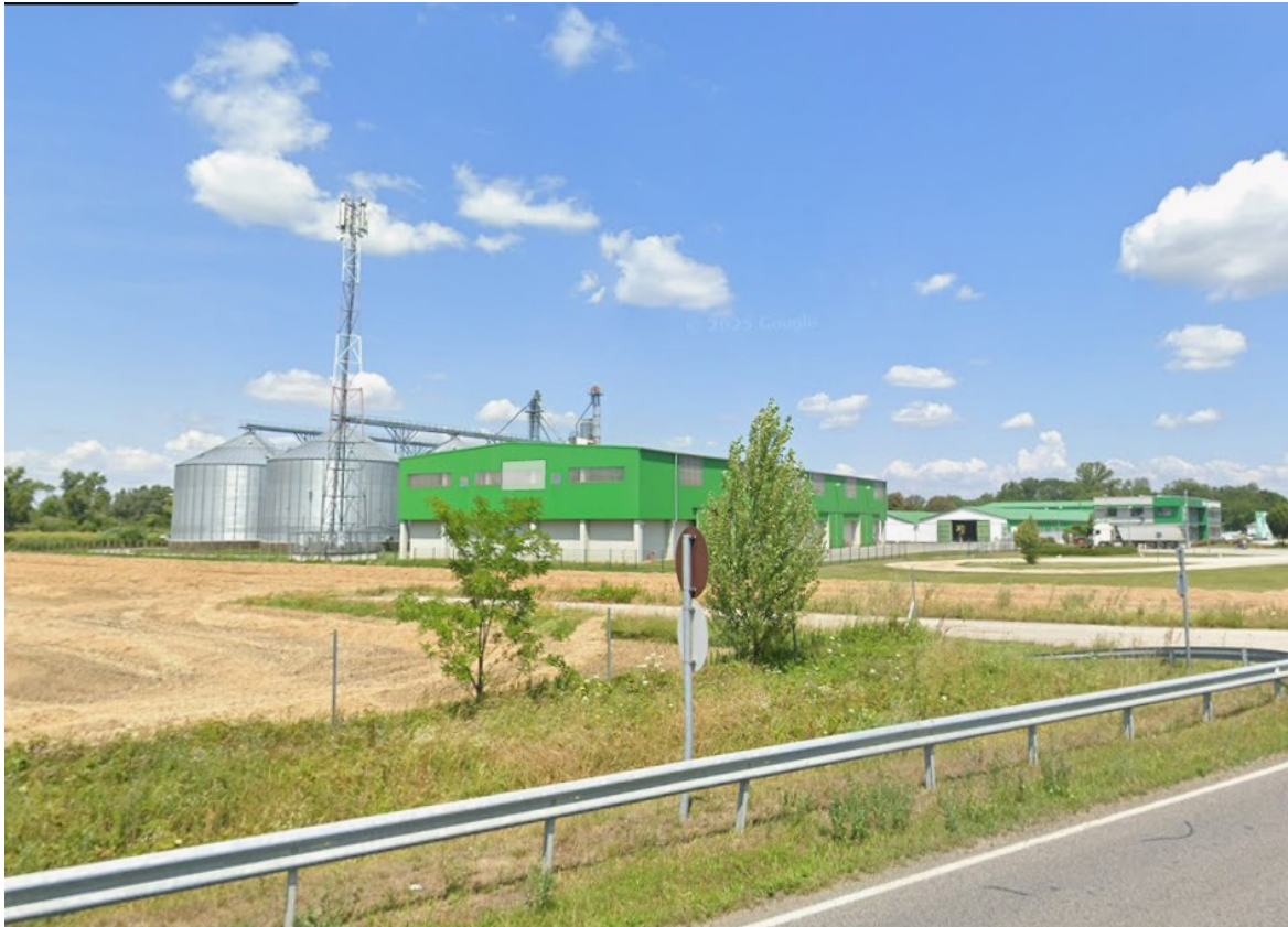
Forrás: Google (az RWA Magyarország Kft telephelye Enese felől érkezte) A telephelyen ma is találhatóak 11,5 méter magas silók