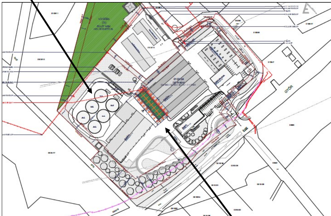
A telephely helyszínrajza (a tervezett műtrágya tároló)

A telephelyen ma is találhatóak 11,5 méter magas silók: