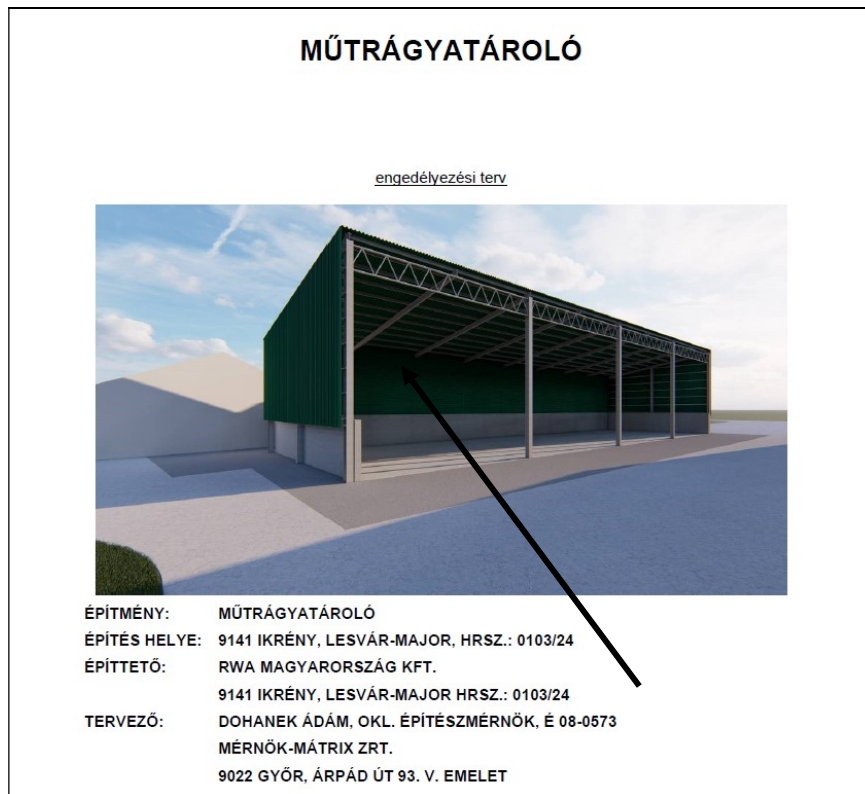
a tervezett műtrágya tároló, forrás: Mérnök Mátix Zrt

A telephelyen az RWA Magyarország Kft műtrágya tároló elhelyezését tervezi, melynek tervezett magassága 10,19 méter.