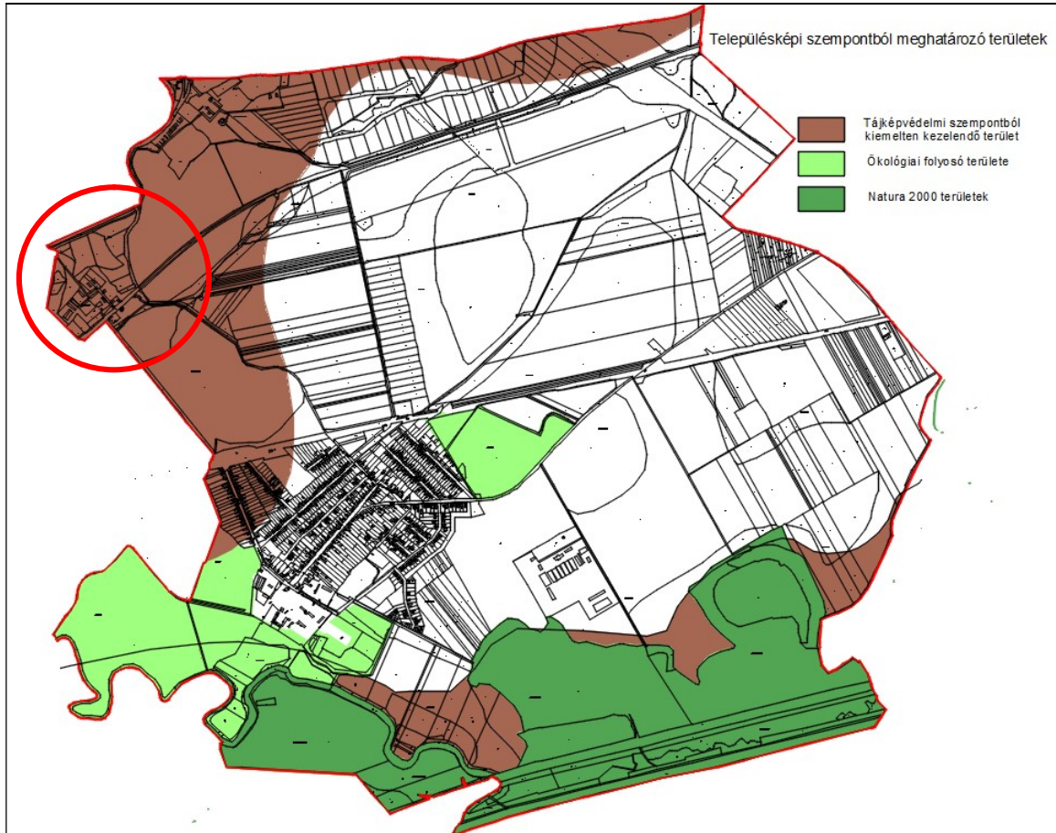
Településképi szempontból meghatározó területek