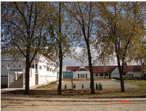
A Sportközpont és az általános iskola

Intézményünk 8 osztályos általános iskola, melynek tagintézménye a helyi óvoda. Oktatási központunk szerves része az alapfokú művészetoktatás. Kihelyezett tagozataink működnek Rábapatonán, Dunaszentpálon és Győrben is.